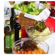
"Ballacks" kleineren "Da- hammwa-den-Salat"

Neben unserer Großbildleinwand wird auch ein weiterer Fernseher für klaren Blick sorgen. Übrigens: Die GEMA lauert überall. Für derartige Events bzw. Public-Viewings sind leider zusätzliche Gebühren fällig - auch für uns als Verein. Kleinere Spenden, Anteile an Ergebnis-Tipps o.ä. werden daher gerne zum