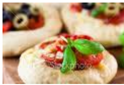
Mini-Pizza "Luca è Mario"