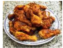
Hähnchenschenkel "Mesut's Pilic"